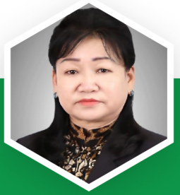
Г.ОЮУН АХЛАХ АУДИТОР