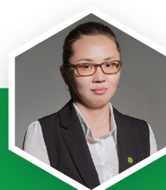
В.АНГАР ТУСЛАХ АУДИТОР