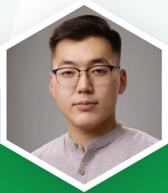
О.БАЯРТ ТУСЛАХ АУДИТОР

Мэргэшсэн Нягтлан Бодогч Татварын Мэргэшсэн Зөвлөх